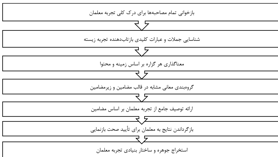
شکل ۱. مراحل روش کلایزی (۱۹۷۸). اقتباس از:

برای مصاحبه نیمه ساختاریافته ۳۹ ، سؤالات اصلی براساس یک راهنمای کلی تهیه شد. همچنین برای هدایت نظام‌یافته‌ی مصاحبه‌ها، پروتکل مصاحبه تنظیم شد. مصاحبه‌ها از معلمان مدارس چندفرهنگی دوره ابتدایی ناحیه یک استان قم، به صورت حضوری و در محیط مدارس انجام شد و مدت زمان مصاحبه از ۴۰ تا ۶۰ دقیقه در نوسان بود. مصاحبه پژوهش حاضر؛ ۲ محور اصلی و ۳ سؤال داشت. در مصاحبه‌های نیمه ساختاریافته، تعیین دقیق سؤالات غیرممکن است، بنابراین ساختار کلی مصاحبه برای همه معلمان یکسان بود، اما آنان آزاد بودند که پاسخ خود را هر طور دوست دارند، بیان کنند. به طوری که در فرایند مصاحبه در مواقع لزوم، سؤالات دیگری به غیر از سؤالات اولیه از معلمان مطرح شد و تمامی پاسخ‌های مشارکت‌کنندگان در حین مصاحبه ضبط و نیز در فرصتی مناسب روی کاغذ نوشته شد. اطلاعات نوشتاری به دست‌آمده از مصاحبه‌ها از روش توصیفی کلایزی ۴۰ (۱۹۷۸) مورد تجزیه و تحلیل و کدگذاری قرار گرفت. مراحل تجزیه و تحلیل اطلاعات از طریق رویکرد کیفی پدیدارشناسی توصیفی بر اساس مراحل هفت‌گانه کلایزی (۱۹۷۸) انجام شد که در شکل ۱ مشخص شده است.